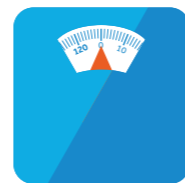
EEN GEZOND GEWICHT HOUDEN