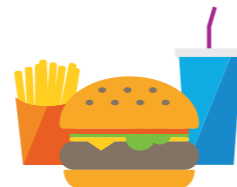
MINDER VET ETEN