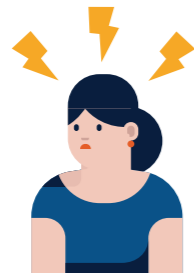
OP EEN GOEDE MANIER OMGAAN MET STRESS