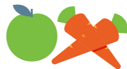
GEZOND ETEN, VEEL FRUIT EN GROENTEN