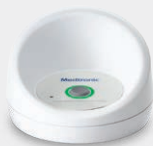
MyCareLink Relay™ 家用通信器 (床边装置)